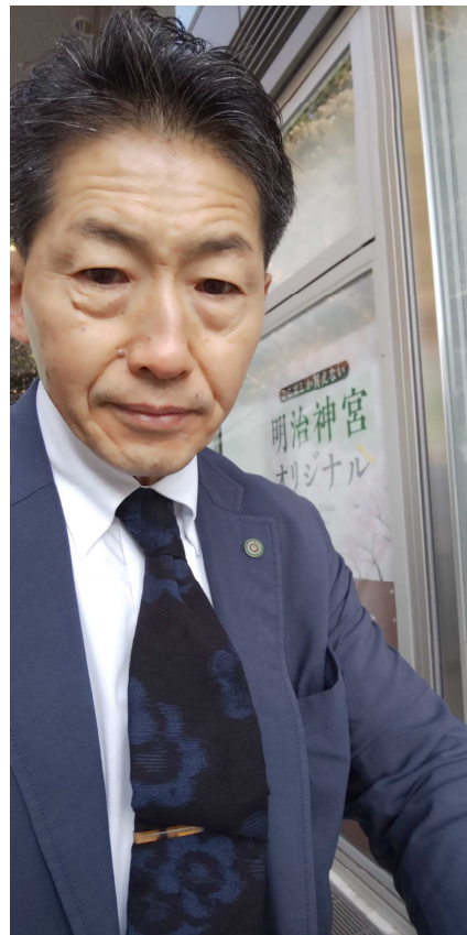
明治神宮テラス 令和元年 12 月 31 日午前 8 時半頃