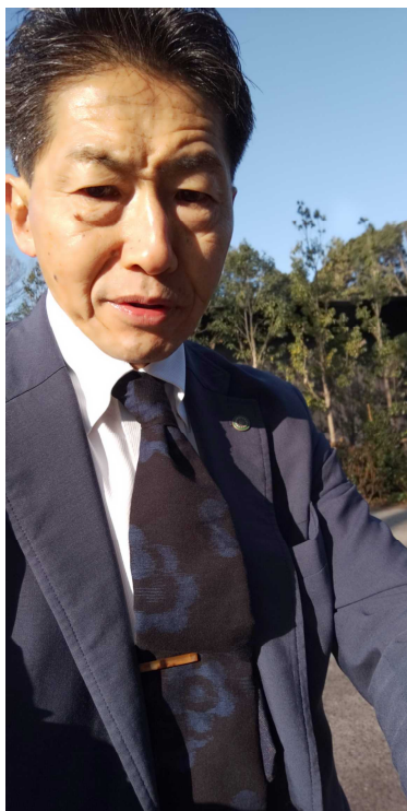
明治神宮ミュージアム裏道 令和元年 12 月 31 日午前 9 時頃