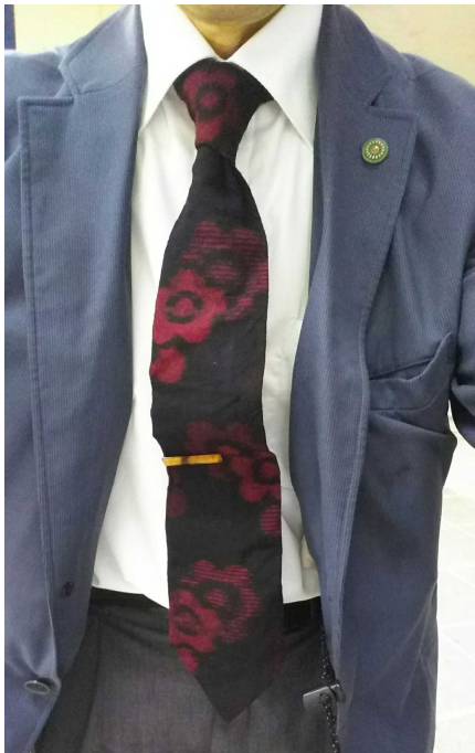
2019 年 3 月下旬新調