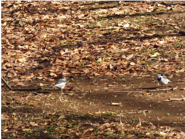
「万葉の鶴鴿とは」代々木公園 2017年12月19日 09:40am