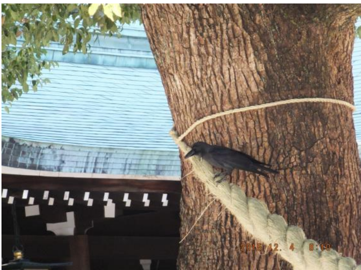
鳥帽子 儼雅 七五三繩 2015/12/4 父母 Noah's Raven 仁鳥 likes the Twinebee... 明治神宮: 「めおと楠」

http://i.dailymail.co.uk/i/pix/2014/01/26/