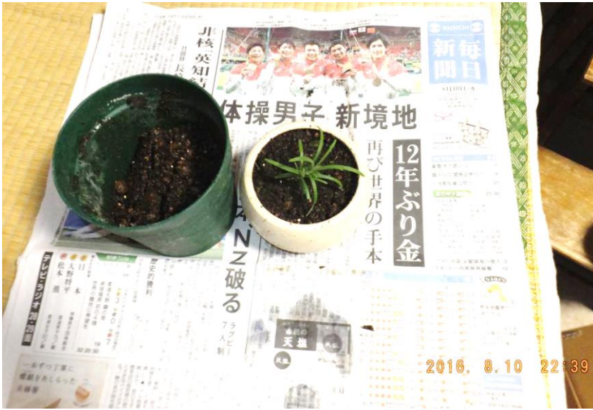
2016.07.30 植換え ↓