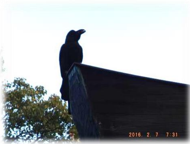
明治神宮 南門鳥居 2016.02.07 07:31am