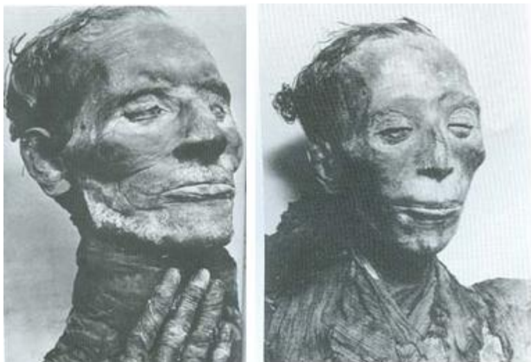
Mummies of Yuya (left) and Tjuyu (right), who were found in the Mono-gamous same tomb

Wikipedia: Yuya (Jewish), Tjuyu (Egyptian)