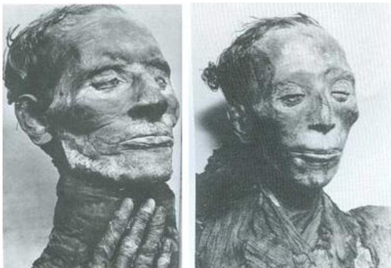
Mummies of Yuya (left) and Tjuyu (right), who were found in the Mono-gamous same tomb

The Yuya-Tjuyu Joseph-Thuya 三 仁 一 仇 儼 Fili-al Fili-stine Mono-gamous origin of the Egyptian-Jewish Chinese-Korean Thread;