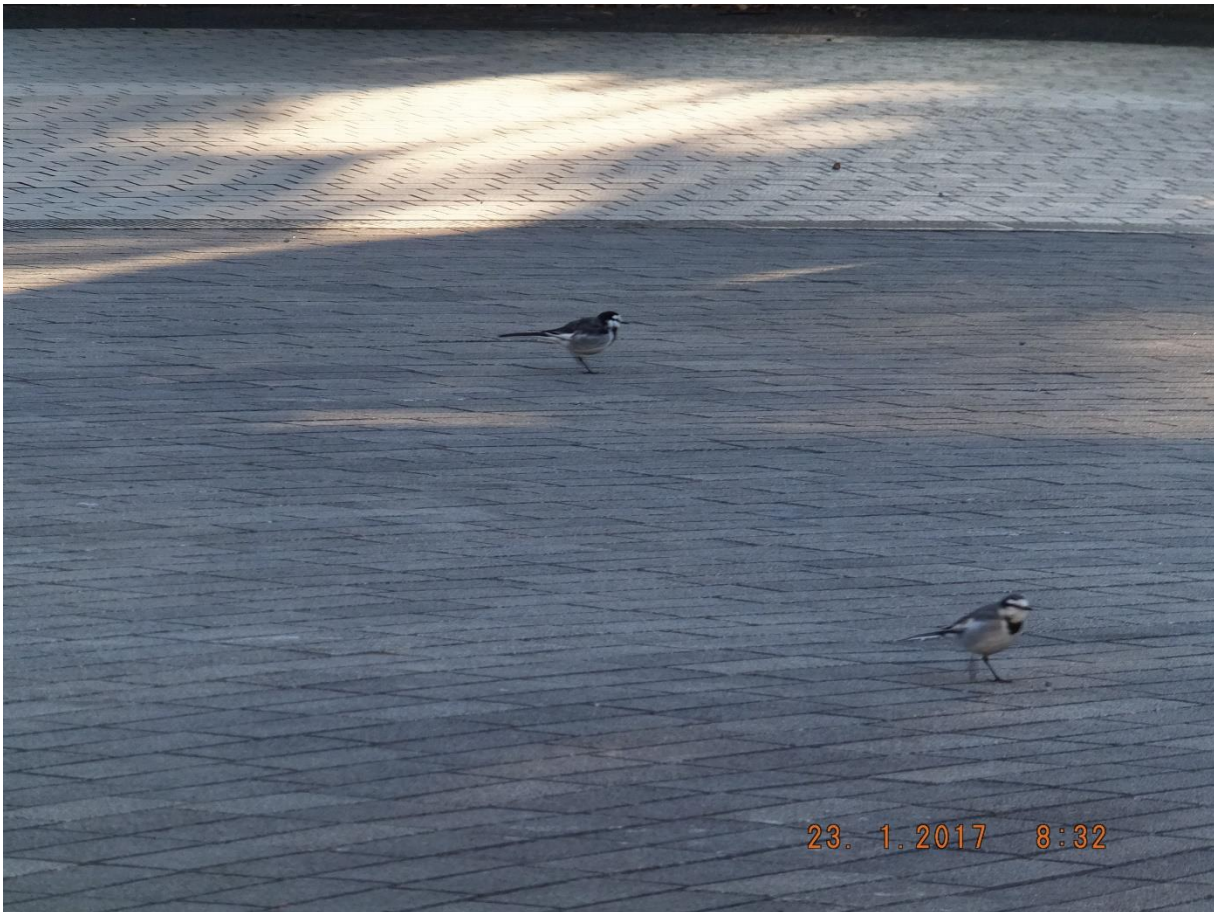
明治神宮文化会館 2017年1月23日 午前8:31