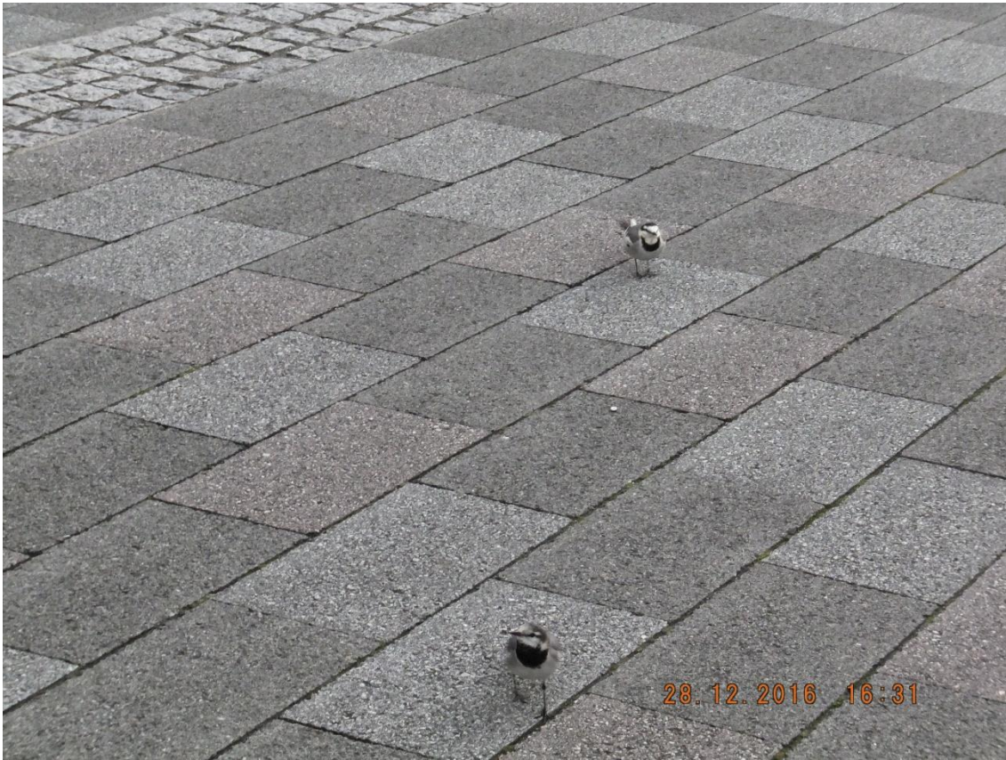
2016年12月28日 大隈講堂前 16:31