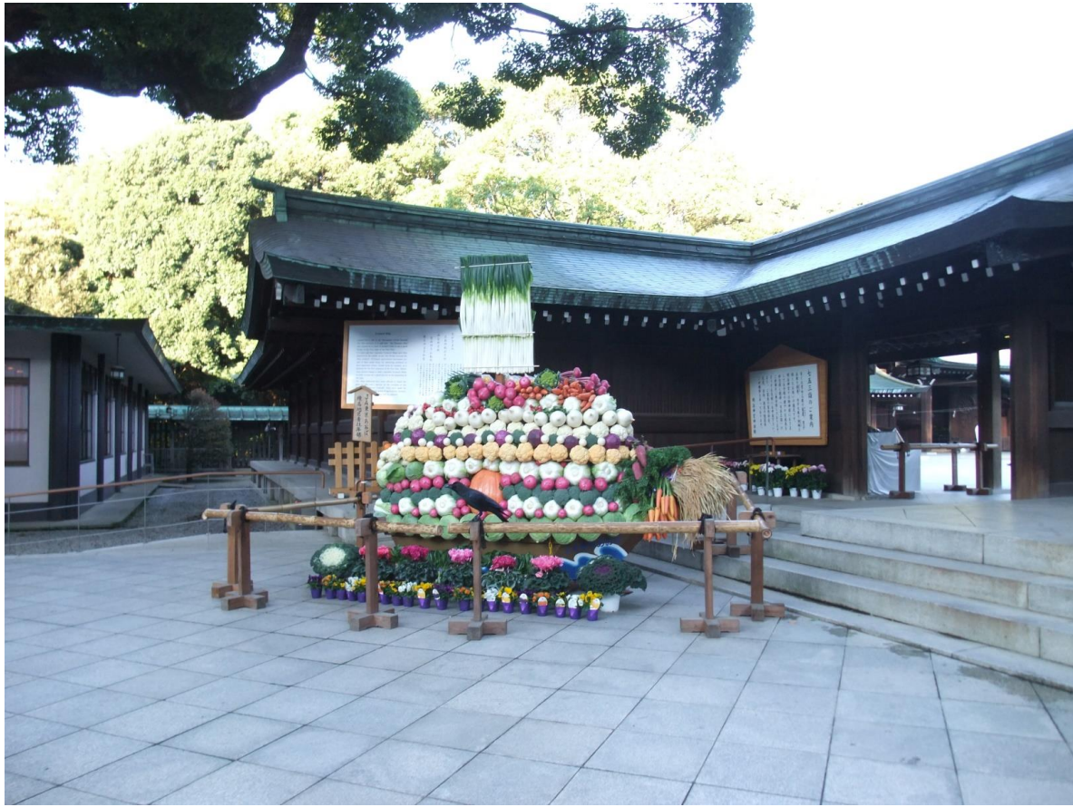
明治神宮・南門 2015.11.21 07:37 「安全食糧の半減期とは!？」